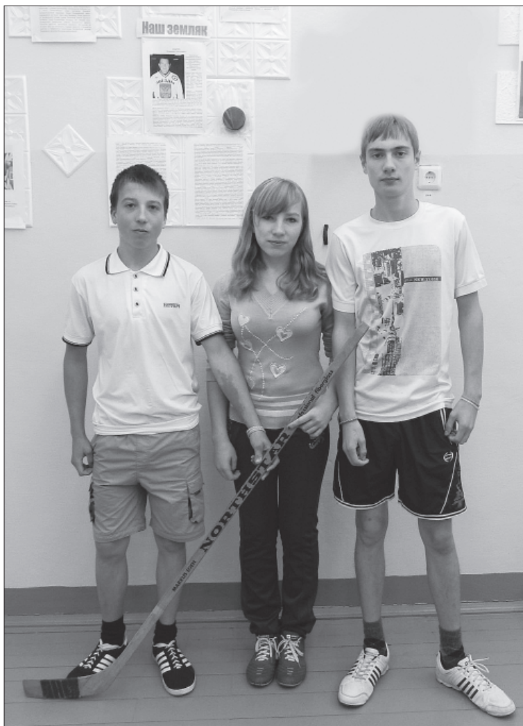
Материал подготовила Е.НИКОЛАЕВА.

Ребята передают горячий привет и приглашают Владимира Николаевича посетить наш район. Тогда исполнится и его мечта – побывать в родных краях, и мечта многих вохомских мальчишек – пожать руку земляку, который добился высоких результатов в хоккее и в жизни.